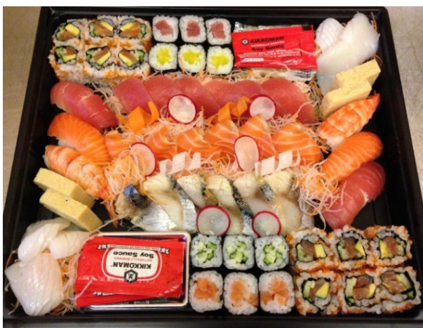
Matsu CHF 135.00 48 pièces

( 6 nigiris & 12 uramakis & 12 makis & 18 sashimis )