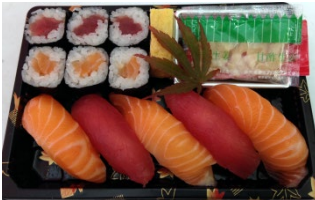
Kaede 11 pièces