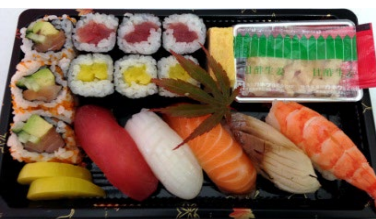
Kuri 14 pièces