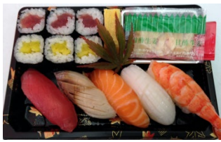
Ume 11 pièces

Il faudra compter au moins 60 minutes d'attente. Merci pour votre aimable compréhension.