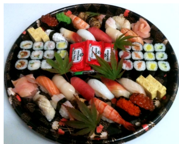
Momiji CHF 135.00 48 pièces

( 6 nigiris & 12 uramakis & 12 makis & 18 sashimis )