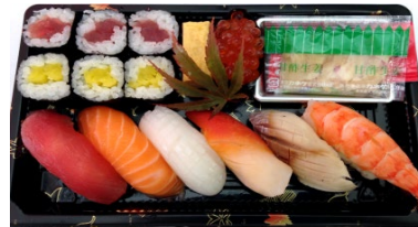
Satsuki 12 pièces